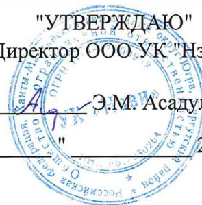
ГРАФИК ПРОМЫВКИ И ИСПЫТАНИЙ

внутридомовых сетей теплоснабжения в жилых домах, находящихся в управлении ООО УК "Нэви", на отопительный сезон 2024-2025 годов по деревянному жилому фонду