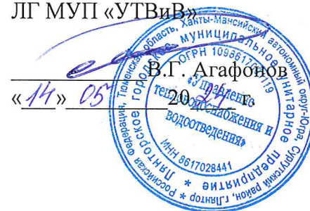
График промывки внутриквартальных сетей ГВС, г.п. Лянтор на 2024 год